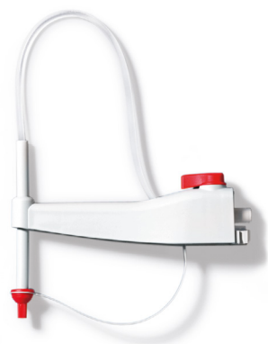
Cánula de valoración con caperuza a rosca y con válvula de salida integrada y válvula de purga

Con los accesorios originales de Titrette® creará las condiciones de trabajo ideales en el laboratorio.