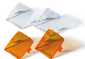
Visor de inspección

1 juego transparente y 1 juego de color topacio (protección contra la luz).