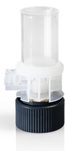
Cilindro dosificador con bloque de válvula