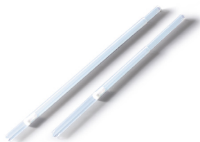
Tubos de aspiración telescópicos FEP