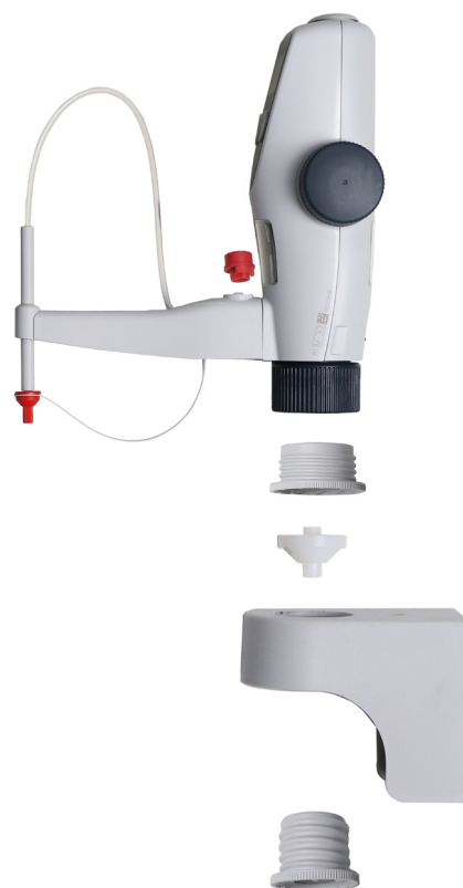
Sistema de extracción Titrette® para sistema de embalaje Bag-in-Box (Titripac® es una marca propia registrada de Merck KGaA, Darmstadt, Alemania)

Encontrará más información sobre Titrette® y los accesorios adecuados en shop.brand.de